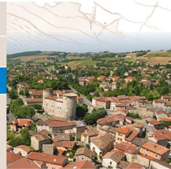
VUE AÉRIENNE D'ANSE

8 Continuer dans la route de Lachassagne. Au bout [👁️ > croix], aller à droite sur environ 100 m, puis virer dans un chemin à gauche. À sa sortie, tourner à gauche sur 10 m, puis prendre le chemin Vigne de la Fond à droite. Traverser le hameau des Carrières.