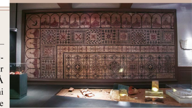
MOSAÏQUE DE LA GRANGE DU BIEF, À ANSE / PHOTO G.T./OTB

Des traces d'une enceinte fortifiée sont encore visibles aujourd'hui dans le vieil Anse, témoignant de la présence d'un castrum à partir de la fin du III e siècle après J.-C. Érigée en pierre blanche de Lucenay entre le V e et VI e siècle, la cha-