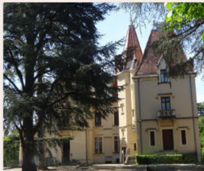
Le château de l'Éclair