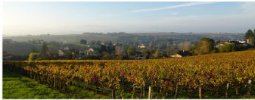
Vue depuis le village de Pommiers