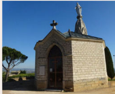
Chapelle du mont Buisante

XIX e siècle pour apprécier la peinture de P. Bruneau.